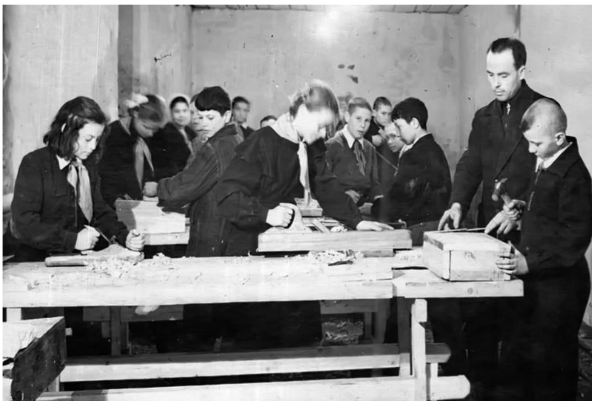
Урок труда. Фото 1956 года