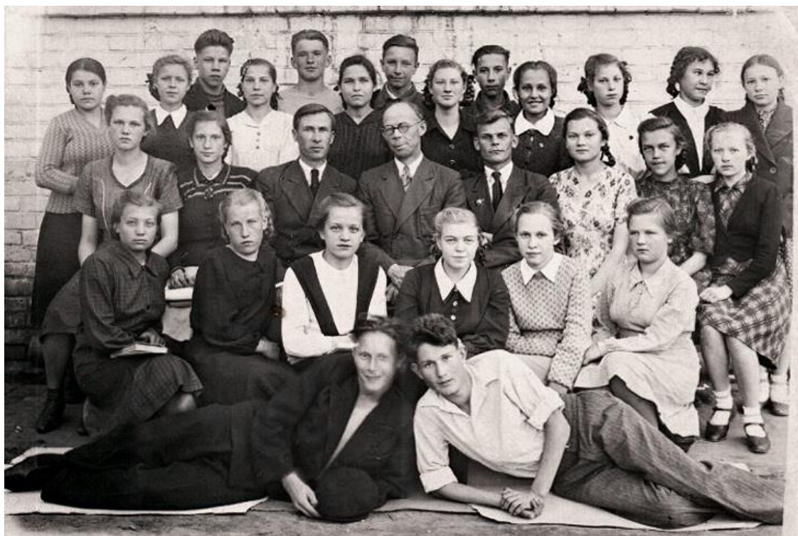
Средняя школа №1. Выпуск 1951 года