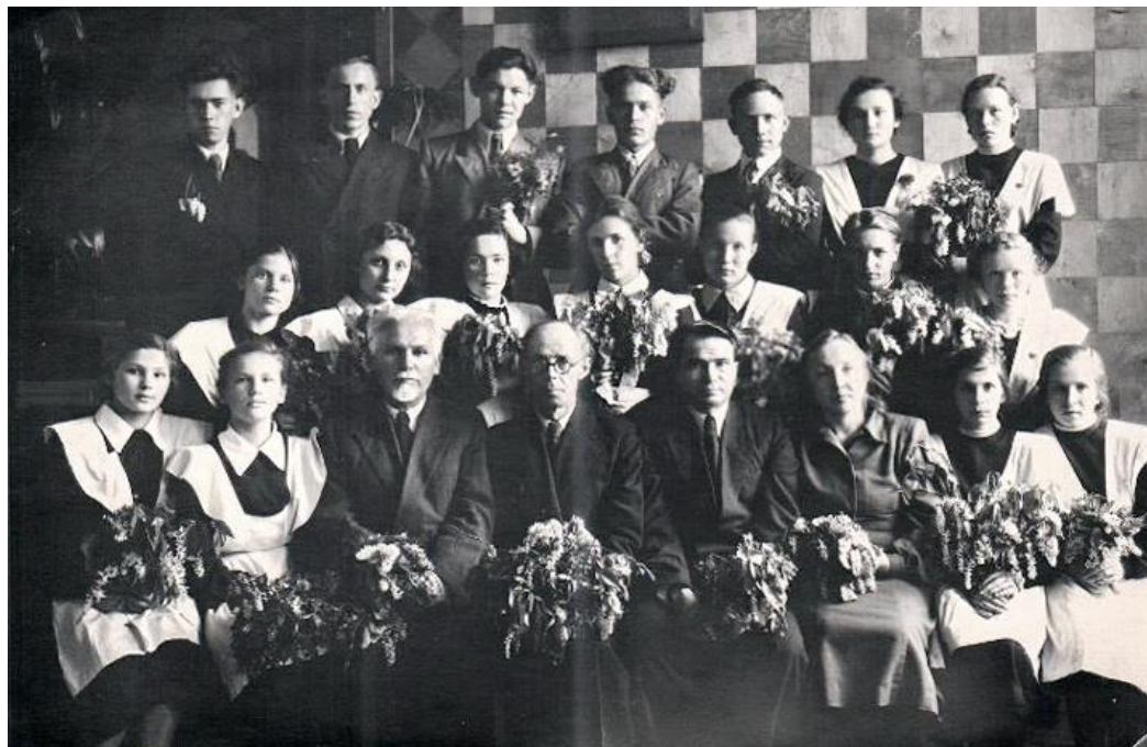
Выпуск 1953 года — 10 «Б»