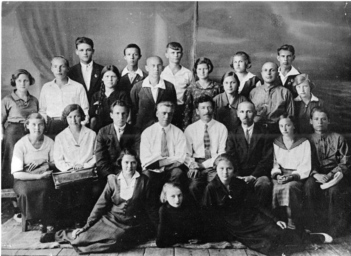
Первый выпуск. 1936 год