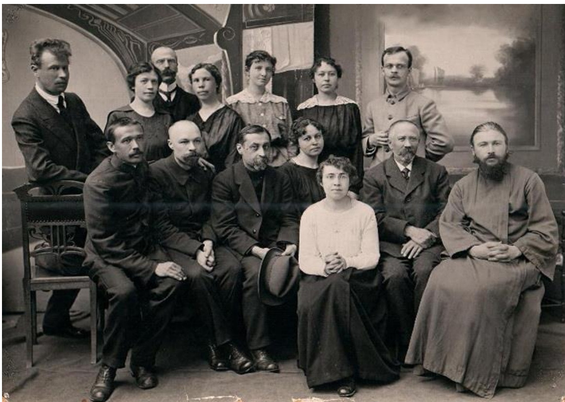
Преподаватели школы № 1 (бывшая Мужская гимназия). Фото 31 мая 1919 года