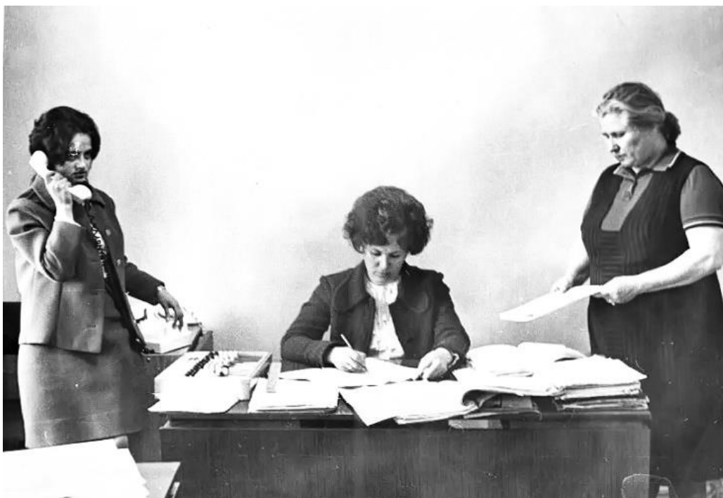
В кабинете директора. Фото 1975 года: