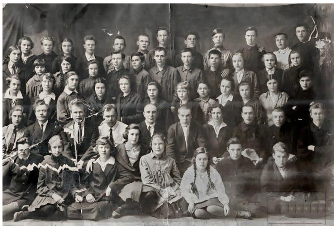
Выпуск 1948 года