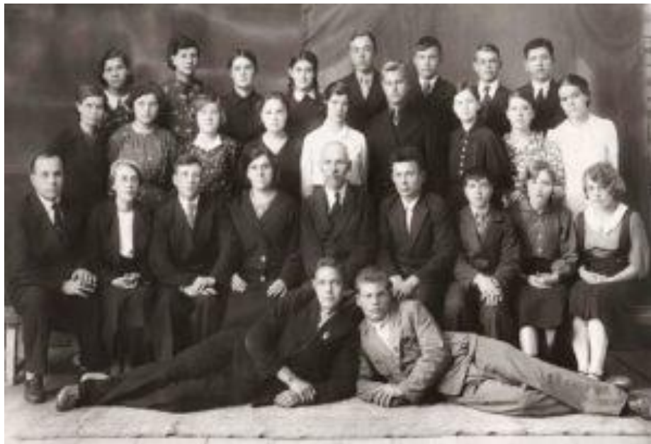
Выпускной 10 «Б» класс. Фото 1939 года: